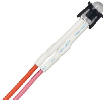
Statusanzeige (zweifarbige LED)